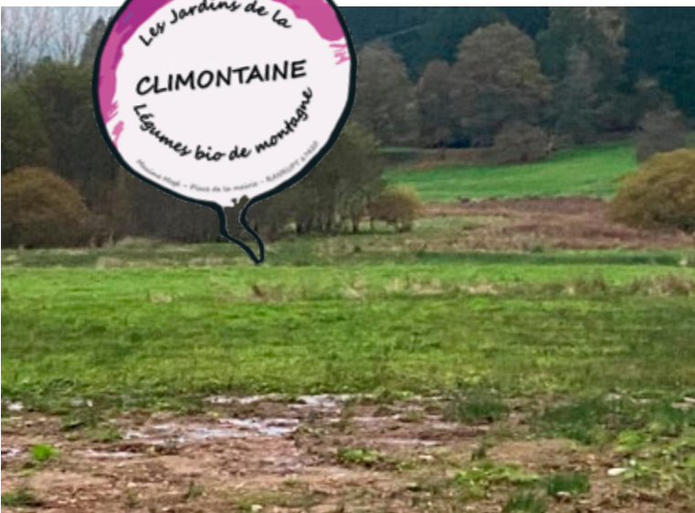
Terrain d'implantation du maraîchage.

Par exemple, l'achat d'un tracteur équipé a bénéficié de fonds européens LEADER à hauteur de 50 000 €, rendant l'opération possible.